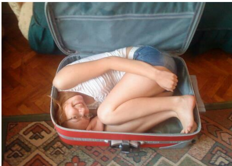
Пун кофер знања

Пре но што сам започела похађање четвртог разреда у Белоцркванској гимназији и економској школи, пријавила сам се за похађање Townshend Internatioanl School у Чешкој Републици, које је требало да траје само три месеца. Часови и полагања су на енглеском језику, а ради се по систему британског универзитета "Кембриџ". Након тога сам дошла у Србију и наредна три месеца ишла у своју школу у Белој Цркви. У међувремену сам добила диплому за најбољег ученика Townshend школе за прво полугодиште. Пошто сам тамо показала добре резултате, понудили су ми стипендију да се вратим и наставим школовање у Чешкој. Тако сам се после три месеца проведена у Србији (која сам иначе искористила да научим и одговорам све оно што сам пропустила од почетка године) вратила у Townshend International School и потрудила да сада ту надокнадим све што сам пропустила за време боравка у Србији.